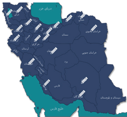
شکل ۱. توزیع جغرافیایی مقالات رسیده به دبیرخانه همایش «مسئله تورم در ایران؛ ریشه‌ها، آثار و سیاست‌ها»

به گزارش دبیر اجرایی همایش «مسئله تورم در ایران؛ ریشه‌ها، آثار و سیاست‌ها»، چکیده‌های مقالات دریافتی به‌طور مشخص با وابستگی سازمانی ۴۰ نهاد آموزشی، پژوهشی و اجرایی در کشور ارائه شده‌اند که در جدول ۱ فهرست این نهادها ارائه شده است.